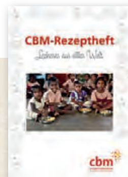
CBM-Rezeptheft „Leckeres aus aller Welt“

Stellt im Rahmen einer Begrüßung das Spendenprojekt vor. Wenn Menschen konkret wissen, wofür Geld gesammelt wird, sind sie auch bereit etwas dafür zu geben.